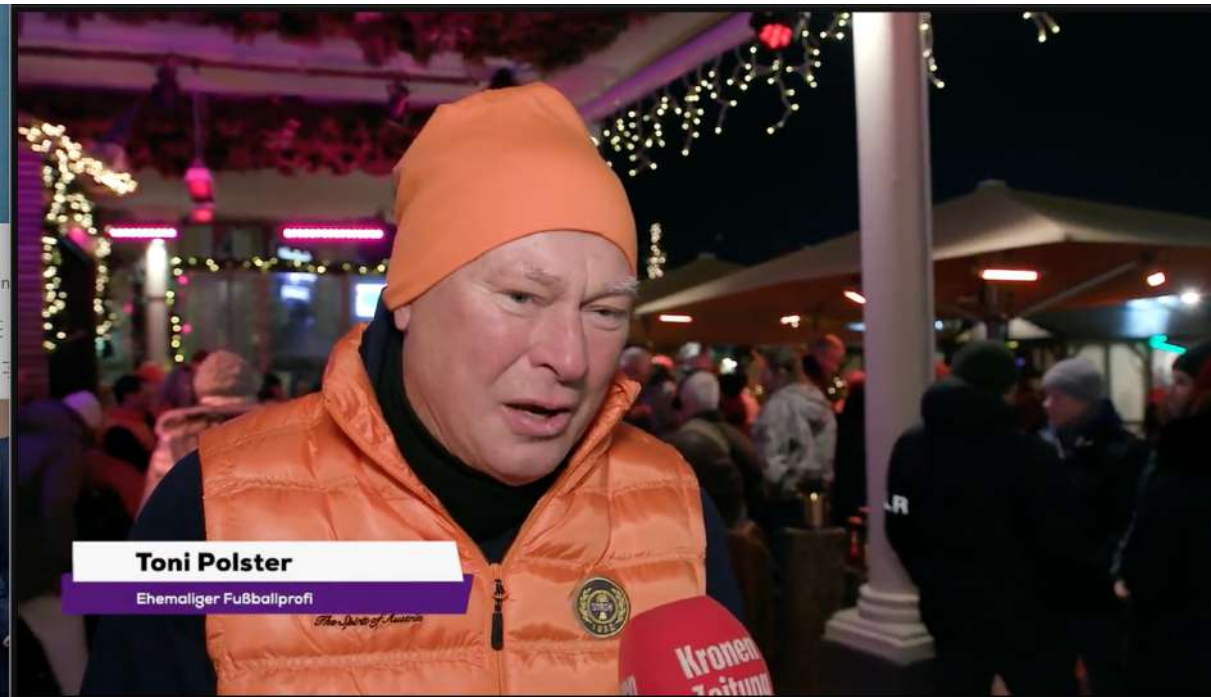
Toni Polster Ehemaliger Fußballprofi