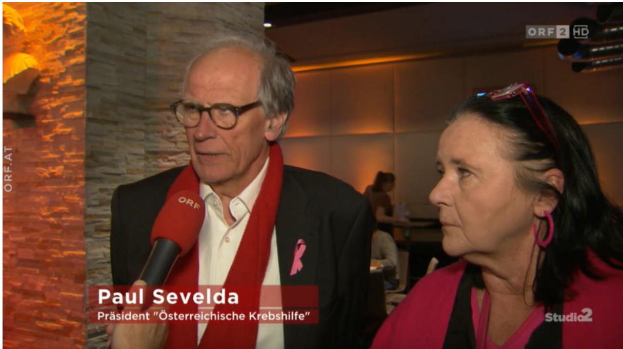
Paul Sevela Präsident "Österreichische Krebshilfe"