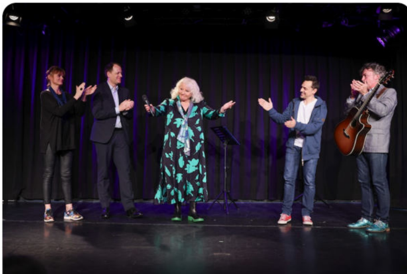
Charity-Abend "Kabarett gegen Gewalt" justdeluxe.at