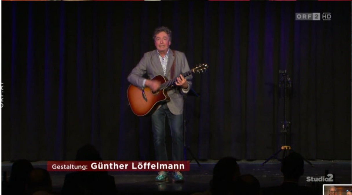
Gestaltung: Günther Löffelmann