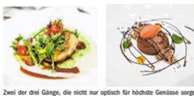
Zwei der drei Gänge, die nicht nur optisch für höchste Genüsse sorgen: geschmortes Kalbschultersteckchen mit Wurzelstock, Kren, Brokkoli und Mousseline sowie Schokoladekissen mit Passionsfrucht.

Der sympathische Wahl-Kärntner hat nicht lange gefackelt, als Marika Lichter ihn spontan fragte, ob er der Gala seinen kulinarischen Stempel verpassen wolle, und gleich seine eigene Küchenbrigade mitgebracht. Wer am Wörthersee Station macht, kann sich in Dellach-Maria Wörth von den kulinarischen Hochgenüssen überzeugen.