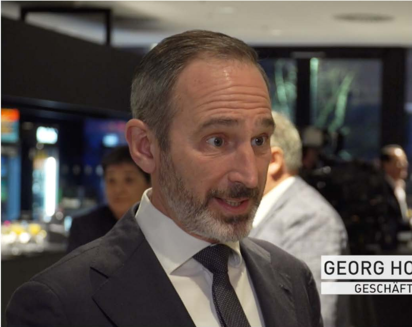
GEORG HO GESCHÄFT