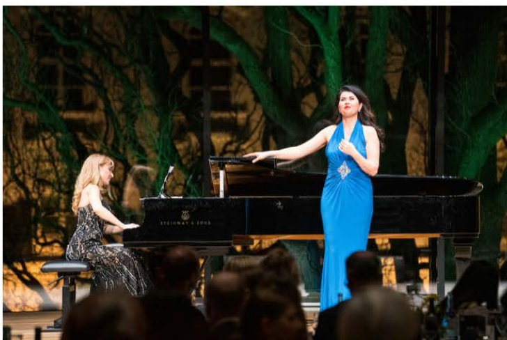
Kushpler